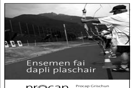
Ensemen fai dapli plaschair

■ (anr/hh) La stad 2012 ha il Bus alpin transportau en tut 23 500 personas. Cun quei diember contonscha el buca dil tut il record digl onn 2010. Responsabels persunter ei en emprema lingia il menaschi dalla Val Blenio el Tessin. In grev stemprau ha donnegiau leu ina punt. Consequentein ha il menaschi stuiu vegnir interruts gia la fin da fenadur. Quei ha menau ad in minus da rondund 2200 personas. Tenor la statistica ha quei incap caschunau ella lingia Greina/Val Blenio il mender resultat dapi ch'ins ha mess en funcziun il Bus alpin. Tut en tut ei vegniu registrau igl onn vargau sin quella lingia 5440 frequenzas. Il pli ault diember ei vegnius contonschiu igl onn 2009 cun totalmeins 8564 frequenzas. Malgrad tut resta quella lingia ina dalle impurtontas e pli fetg frequentadas dil Bus alpin. Els ulteriurs loghens ha il Bus alpin saviu augmentar las frequenzas per rodud in pertschien. Els megliers resultats contonschan las regiuns Alp Flix el cantun Grischun e Chasseral els cantuns Berna/Neuchâtel. Sin fundament dil bien success preveda l'organisasiun Bus alpin d'extender sia purschida ils proxims onns. Ellas regiuns da Chasseral, Gantrisch e Moosalp vegn il Bus alpin era purschiu igl unviern. Cheu vegnan ils passagiers menai allas loipas ni allas pistas da skis.