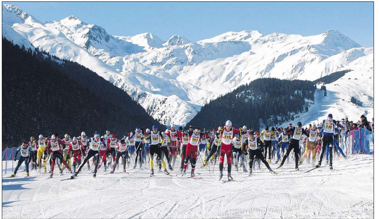
L'elita da cuorsa liunga ei uonn pliras ga a Sedrun