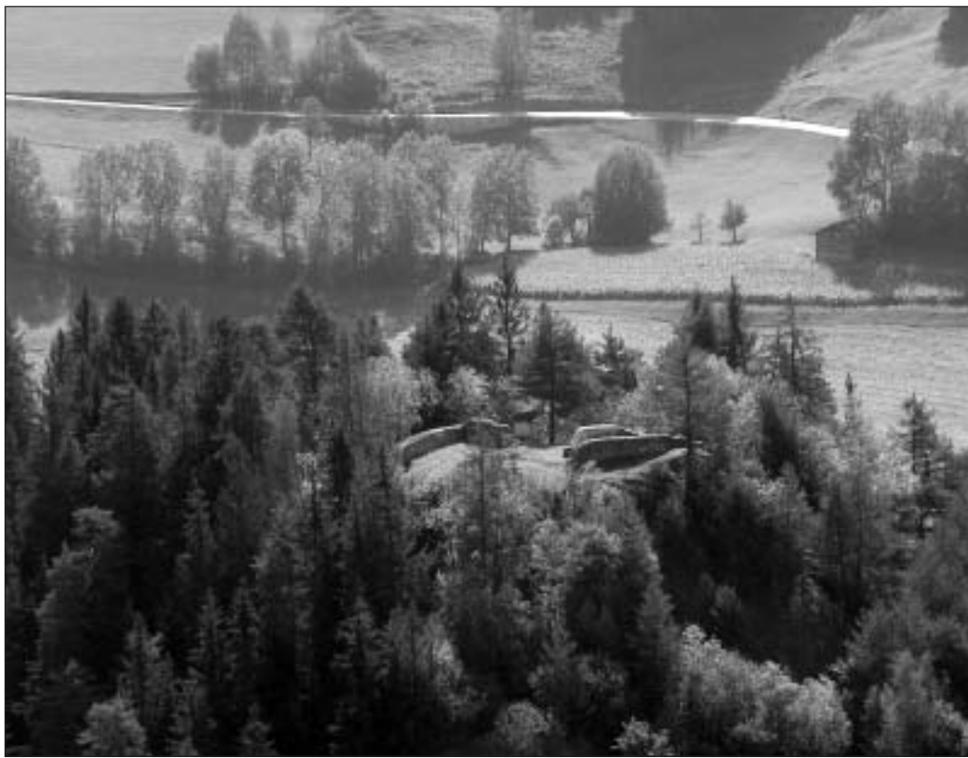
Il casti da Schiedberg, sedia dils Victorids, la casa da Tello a Sagogn: En quei contuorn serevela entochen la fin digl onn in misteri dil testament da 765.