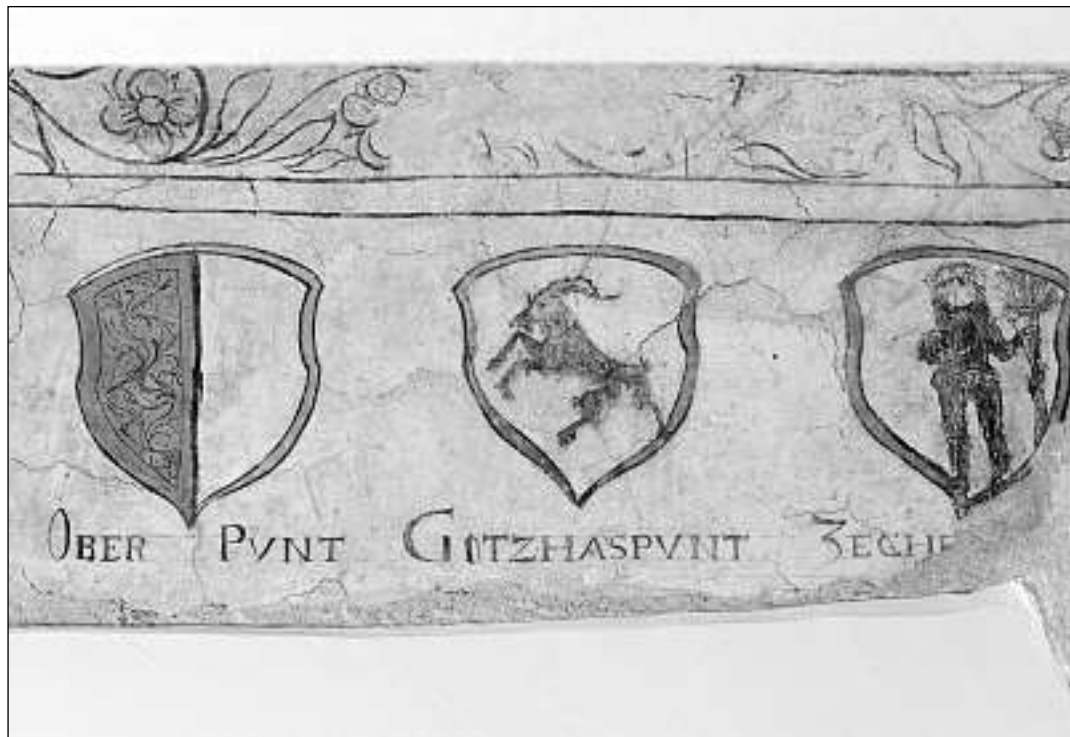
Las armas dallas Treis Ligias. Successiun officiala dallas armas dallas Treis Ligias