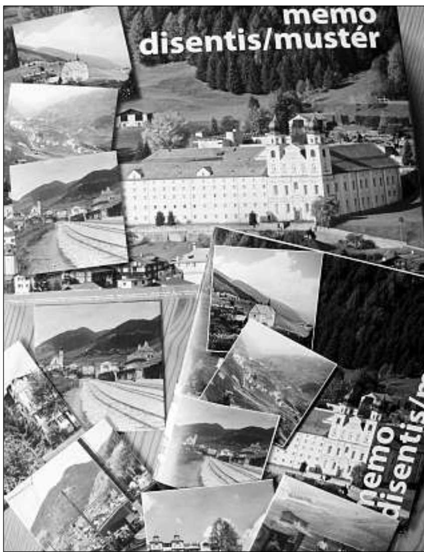
Il memori e la brochura accompignonta dalla Ludoteca Mustér.

Avon 15 onns ha la Ludoteca Mustér aviert sias portas