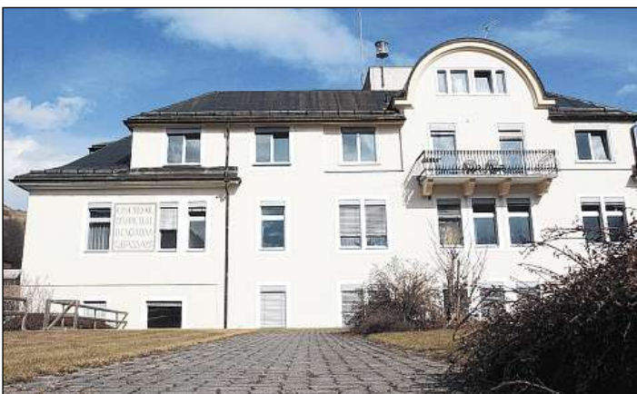
L'Ospital d'Engiadina Bassa vain ingrondi.

chastè da Tarasp u en general dar ora quels raps per la giuventetgna e ses avegnir. Uss stoppian ils adversaris da gieus olimpics surpigliar la responsabladad e far propostas per l'avegnir en il Grischun, hai num davart dals promoturs. Il turissem grischun stoppia augmentar la qualitat dals products ed ins stoppia procurar per bunas candidaziuns da basa. Quai di il president da la ps grischuna Jon Pult che vul preschentar proxima-main novas ideas per il turissem en il chantun. Il minister da turissem Hansjörg Trachsel è persvadi ch'igl è dad ir la via instradada, quai vul dir rinforzar las stentas sin ils martgads sco la China, l'India u la Brasilia.