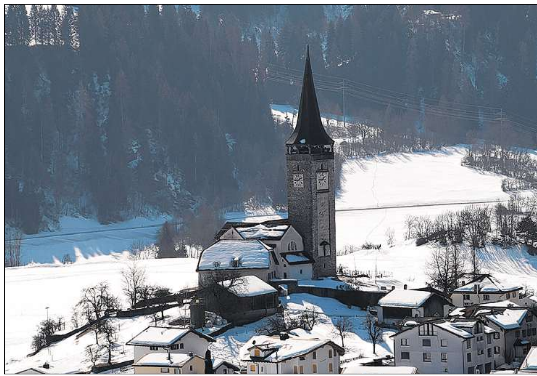
Il crest dalla baselgia catolica da Sagogn sco quei ch'el ei oz. Dapi 1500 onns eis ei in liug da cult.