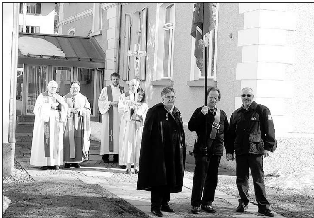
Ils spirituals sin via en baselgia.

Per la participaziun e cooperaziun ha la presidenta engraziu alla fin. Ella ei stada ferg impressiuada da quei bi survetsch di-vin, envidond tuts ad in refrestg ella casa-pervenda vischina.