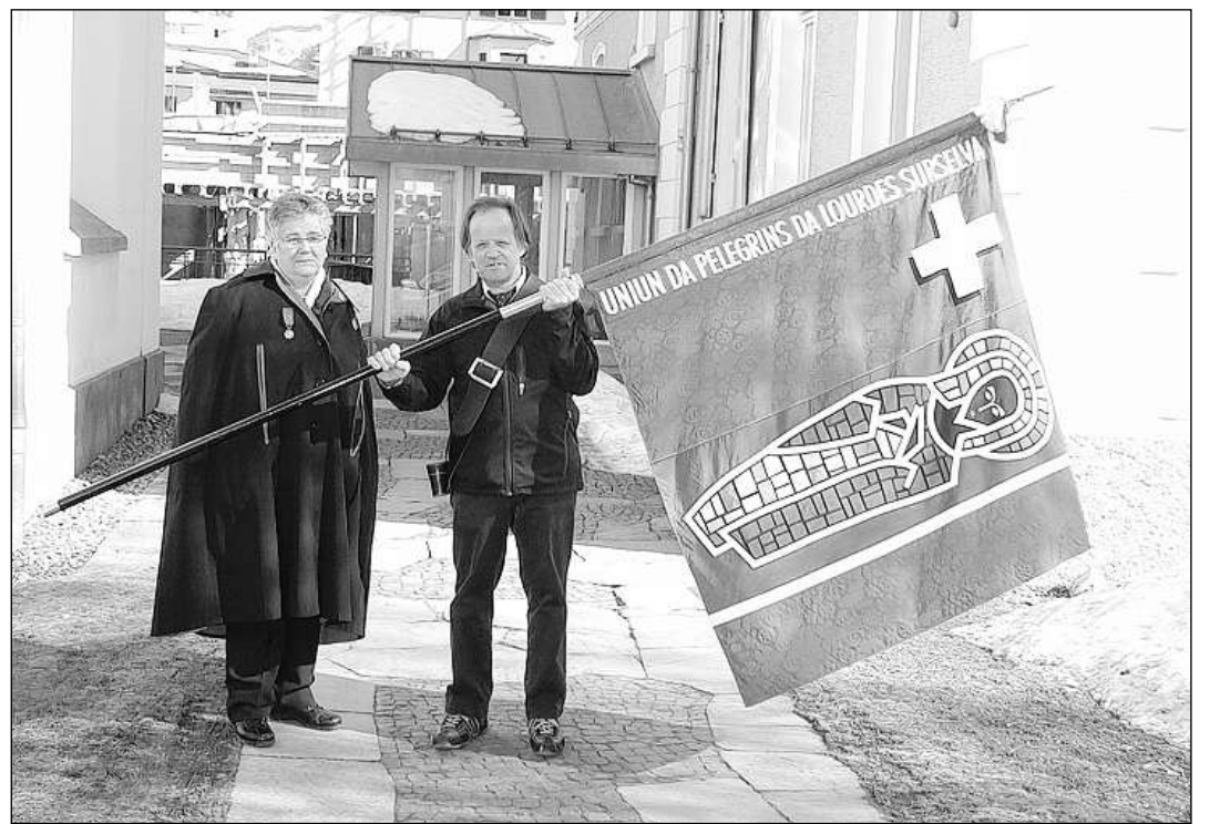
La bandiera dall'uniun.