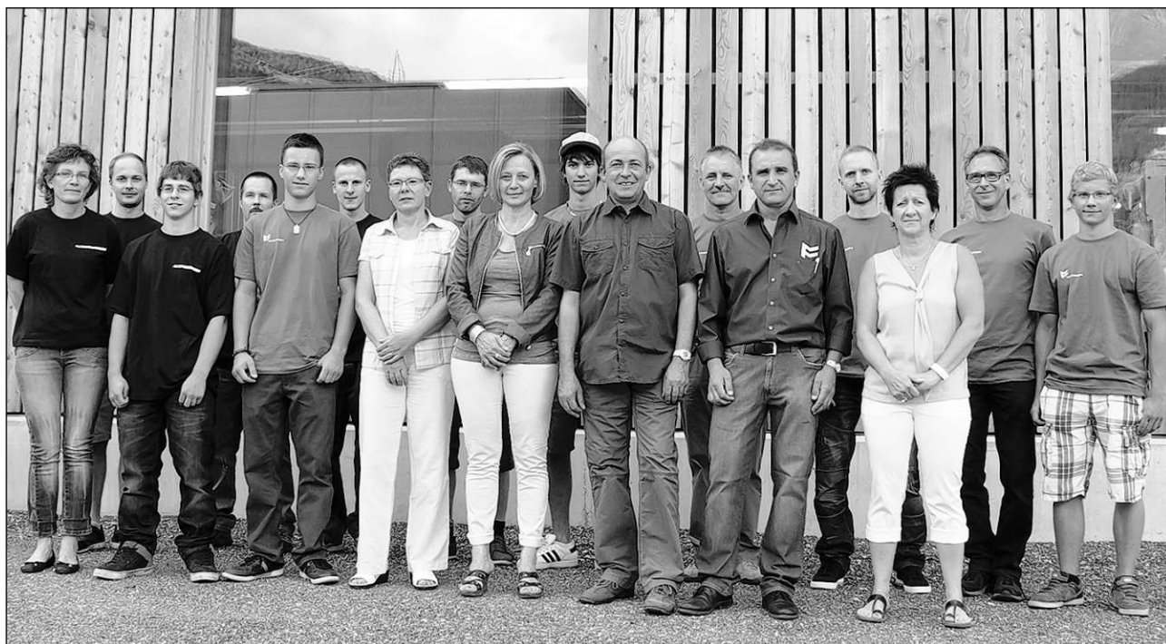
Las duas interpresas Scrinaría Flepp SA ed Auto Huonder GmbH porschan ensemen 16 piazzas da lavur cumpleinas. Ellas ein las empremas duas interpresas ch'ei secasadas ella nova zona da mistregn a Mustér/Pignola.