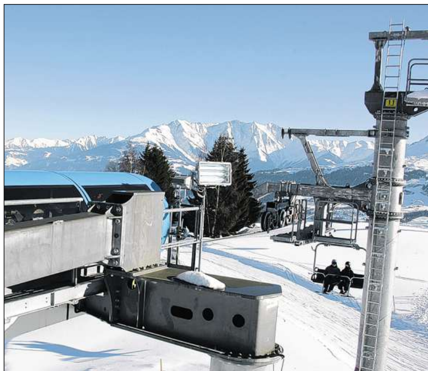
Las Pendericulas Breil Vuorz Andiastr han nudau igl onn da fatschenta 2012/13 dapli entradas ch'igl onn avon, duvrassen denton in milliun dapli entradas. Quellas spetga la societad dalla realisaziun dil resort. MAD

Gist tschintg restaurants grischuns han obtegnì 16 puncts e quai conferma danovamain che noss chantun è in paradisi per mangiabains. Dals 856 restaurants che figureschan en il «Gault Millau» 2014 derivan tuttina 80 dal Grischun.