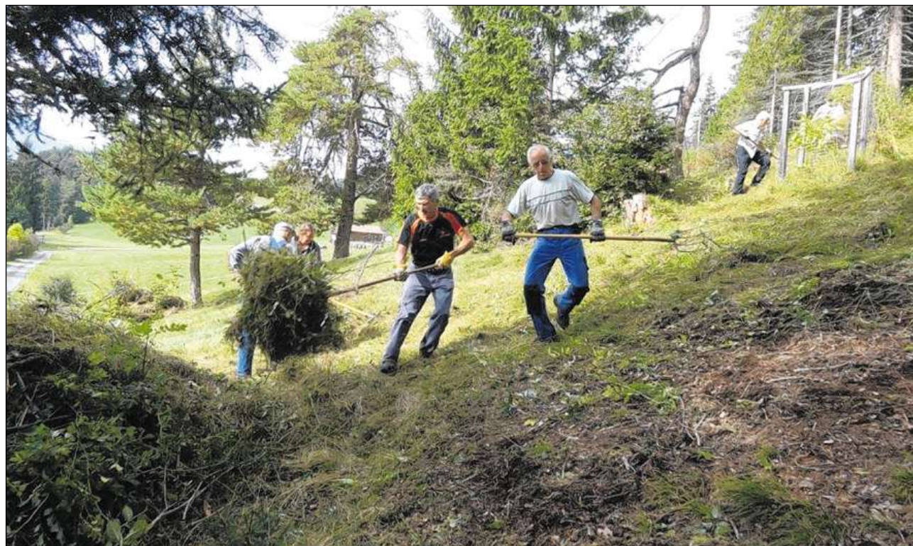
La Pro Sagogn s'engascha per la cultura, per la natira e per l'economia: En tuttas treis spartas porscha ella mintg'onn enzatgei. La foto muossa la grupp che ha prestau dacuort lavur cumina a Planezzas.

L'empresca sentupada dalla Pro Sagogn ha giu liug ils 14 d'avrel 1993, pia avon 20 onns. Alla radunonza generala ha il president menziunau quei giubilium senza far grond brimboli. Igl impurtont facit ord 20 onns lavur ei ch'ei ha valiu la peina da tener stendiu, da prender tut cun pazienza, da realisar ideas, da sensibilisar la populaziun pils agens scazis e d'involver pign e grond ellas activitads. Naven dall'entschatta eis ei era vegniu offeriu ina excursiun ornitologica. Suenter ina interrupziun da plirs onns eis ei previu da cuntinuar cun tala purschida. Primavera proxima vegn l'indigena Jeanette Cantieni a mussar als interessai la variaziun d'utschals. Pil meins da mars digl onn proxim eis ei previu in referat ch'ei dedicau all'economia. La Pro Sagogn ha envidau in referent fetg prominent.