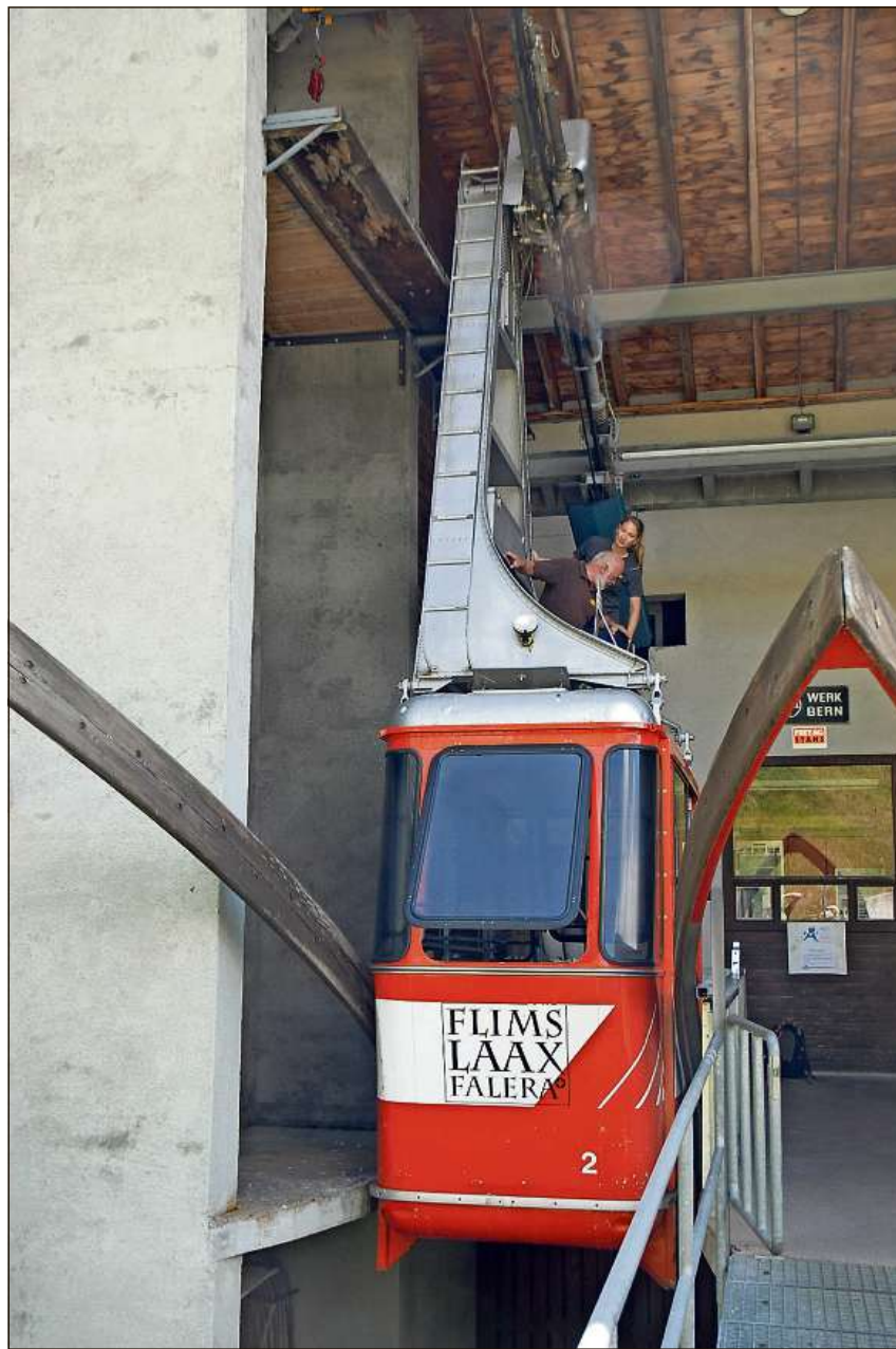
Quella parcella el vest da Glion duei vegnir surbaghegiada. Uss eis ei clar ch'ei dat bucc in tancadi cun stizun da Coop Pronto. Ina dallas cabinas dalla pendiculara da Cassons: Sch'ellas vegnan vendidas ni dadas en emprest ella casa da traffic a Lucerna ei aunc bucca segir.

La construcziun dallas stizuns grondas Lidl e Landi ella zona d'industria e mistregn Isla-Schluen s'avonza. Ton tier la situaziun a Glion ost. A Glion vest s'avonza daferton la construcziun dil sviament culla punt e las rondellas. Sper la rondella nova ch'il cantun baghegia per sviar il traffic encunter Lumnezia, Sursaisa e la zona d'industria Santeri duess ei dar in tancadi niev cun ina stizun nova d'in grossist. Ei constetti ch'ei seigi planisau da baghegiar in center da