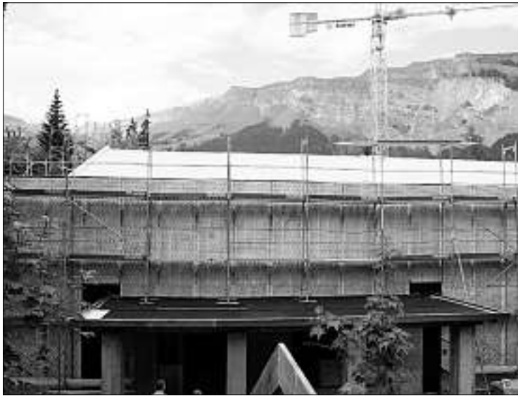
In Flims Waldhaus entsteht die neue Curling- und Event-Arena mit sechs Rinks, die im Oktober eröffnet wird.