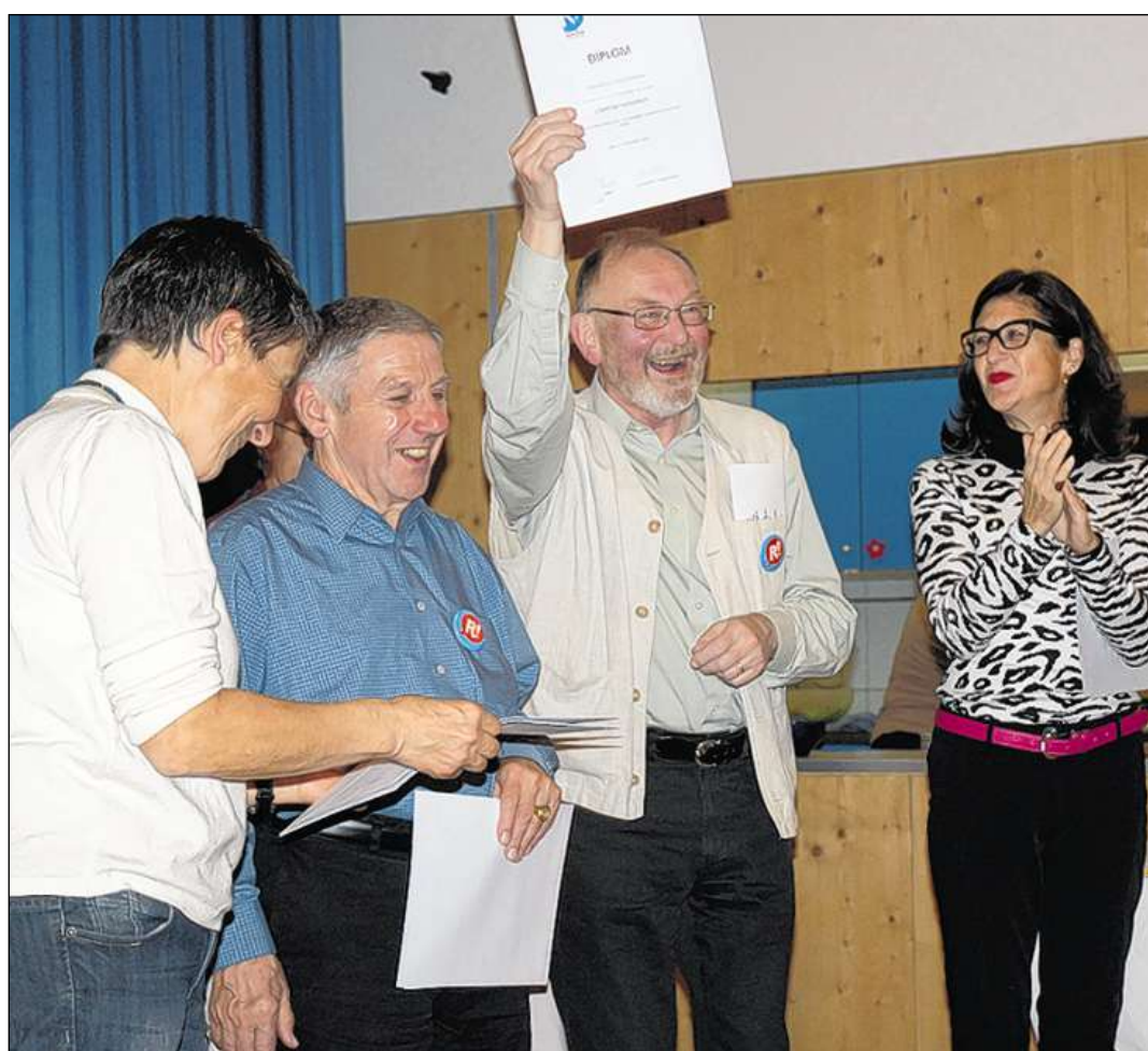
Ils partecipants dal cuors a Sent s'allegran da lur diplom chi han survgni per ün'eivna be rumantsch.