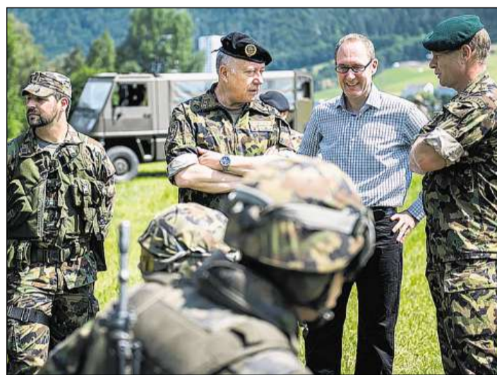
Il schef d'armada André Blattmann en visita en il Grischun.

La Banca Chantunala Grischuna beneventa il barat d'infurmaziuns automatic. Alois Vinzens, il directur general da la Banca Chantunala Grischuna, è persvadì che dar si il secret da banca envers l'exteriur saja l'unica schliaziun. Quai ha ditg Vinzens en in'intervista cun la gasetta «Schweiz am Sonntag». Sunter che la taglia d'indemnisaziun haja fatg naufragi na vesia el nagina alternativa tar il barat d'infurmaziuns automatic ch'è vegni preschentà venderdi d'ina gruppa d'experts.