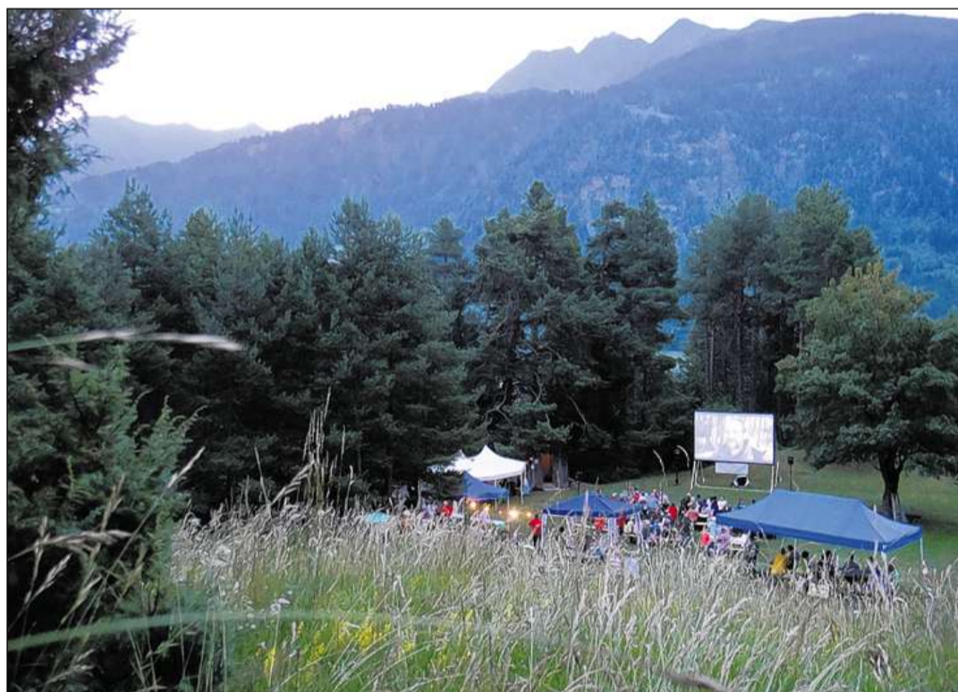
La pastira da Plaun Pigniel sur il vitg da Sagogn ei dapi generaziuns liug da sentupada per fiastas da tut gener. Dapi zacons onns vegn era organisau cheu ina notg da kino sut tschiel aviert.

Il 15avel Kino Open Air Sagogn ha liug sonda, ils 22-6-2013 allas 21.30, Plaun Pigniel sur il vitg. Avertura dil plaz allas 19.00. Allas 20.00 beinvegni ed introducziun cun Jan Poldervaart. Pusseivladad da parcar igl auto el vitg. Spassegia da 10 minutas tochen al liug, igl access ei signalisau. Cussegliabel eis ei da prender ina cozza da launa encunter il frestg dalla notg ed ina pintga cazzola pil return. Da marcort'aura ha la notg da kino liug ella halla polivalenta dalla casa da scola.