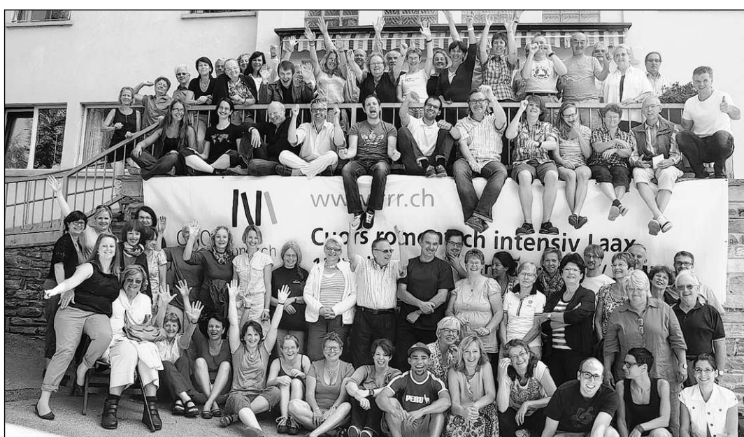
Las participantas ed ils participonts dad onn cuagl entir team d'instrucziun avon Casa Caltgera.