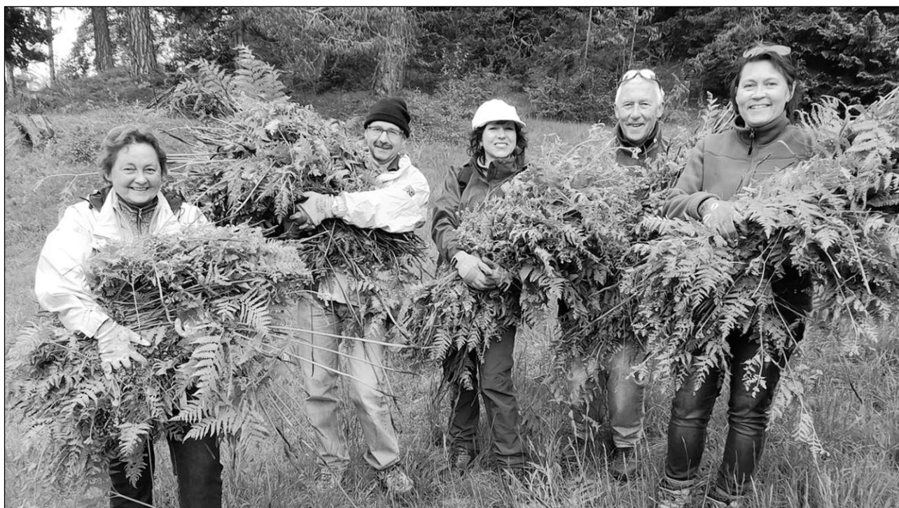
Lavur stentusa per dar plaz allas orchideas sa esser recreonta: La gliud dalla Bassa che vegn tier nus aposta pervia d'ina natira pura admira perinagrada quei engaschi.

■ (anr/abc) Avon dus onns ha l'uniun Pro Sagogn entschiet in project da plirs onns. Dalls 73 sorts dad orchideas che creschan en Svizra han ils specialists saviu confirmar 26 sin terriori da Sagogn. E quei ei in scazi discret che la Pro Sagogn vul conservar. Dacuort ha l'acziun da scarpur ora faletga puspei giu liug. Aunc avon 50 onns mavan las nuorsas cul pastur reglarmein ellas aclas. Uaul, pastiras e praus eran zavrai claramein e separai cun seivs. Sco dapertut ei la cultivaziun dil funs semidada cumpletamein. Era a Sagogn s'avonzan las caglias e la variaziun ella natira pigiurescha pli e pli. Persuenter ei igl interess per la natira carschius. Sin excursiuns emprend'ins oz d'enconuscher las fluras ch'ins scarpava pli baul ora per purtar in matg alla mumma ni alla tatta. Quei capitava savens cullas orchideas, per exempel la pantofla-Nossadunna che ha stuiu vegnir schurmegiada cun decret federal. Oz apprezzieschan jasters e dumias in prau cun ina flora varionta e colorada. Buca mo casualmein han ins semnav ilz urs dalla piazza da golf a Sagogn e Schluein cun margretas, scabiosas, salvigias, treifeleg ed auter. La runda da golf fa aunc pli grond tschaffen sch'ins sa contemplar ina cuntrada verda cul