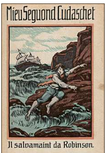
Il salvamaint da Robinson.