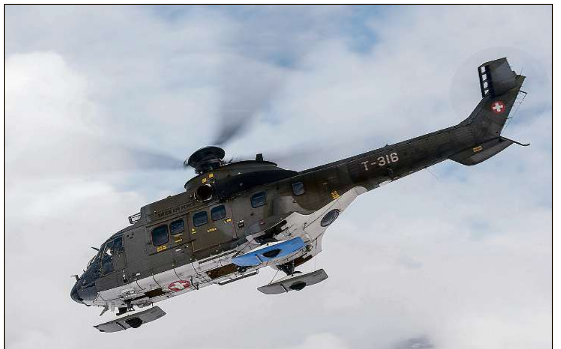
D'ürant il FEM procuran ils elicopters e'ls aviuns da l'aviatica svizra per daplü canera co uschigliö.