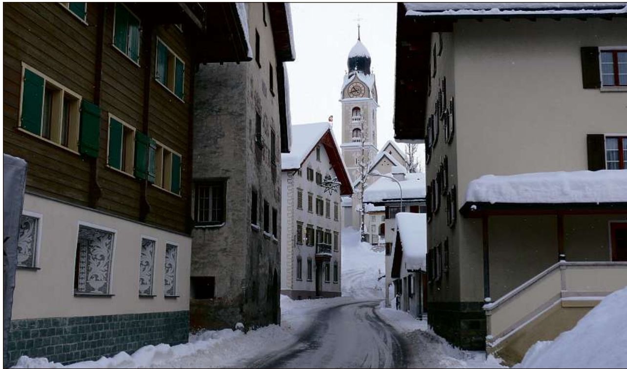
Ils proxims meins sefatschentan las vischnauncas da Trun e Sumvitg (foto) d'ina eventuala fusiun.

Il biro vegn ad accumpignar ina cumissiun intercomunala tier l'elaboraziun d'in project da fusiun. «Duront l'elaboraziun dil project duei la populaziun vegnir informada regularmein davart las examinaziuns. Vegn quella cumissiun alla conclusiun ch'ina fusiun dallas vischnauncas porta dapli avantatgs che disavantatgs duei la populaziun da Trun e Sumvitg votar davart la fusiun», communichechan las suprastanzas communalas.